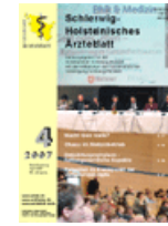
Schleswig-Holsteinisches Ärzteblatt 4/2007