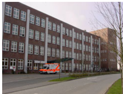
Schmerzlinik in Kiel